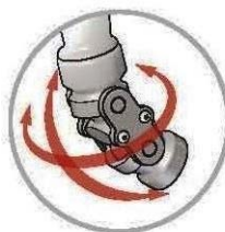
Giunto girevole snodato per facilitare tutte le posizioni